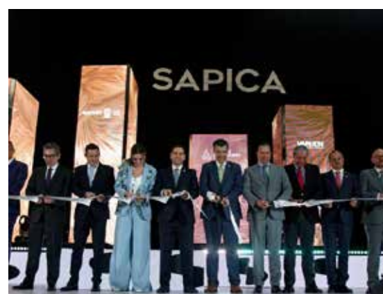
Ceremonia de Inauguración de SAPICA