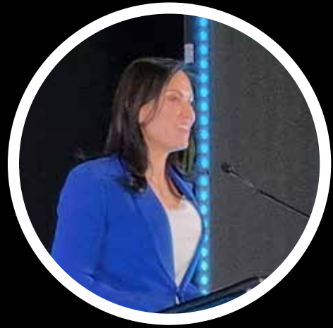
Alejandra Gutiérrez Campos, Presidenta Municipal de León

“Reconozco la vocación zapatera de la ciudad y celebro los 50 años de vida de SAPICA, que ha sido una feria detonadora de negocios, prosperidad y crecimiento para León; siendo el oficio del calzado y la marroquinería, identidad y vocación de la ciudad, reconocida en el mundo como “La capital mundial del calzado”.