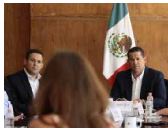
Reunión Privada de Industriales presidida por el Gobernador del Estado, Diego Sinhue