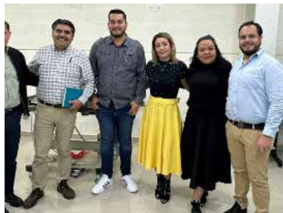
Reunión de seguimiento a la estrategia de colaboración IECA-CICEG