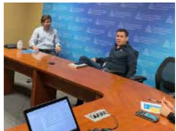
Reunión con el Subsecretario de Formación y Empleo de la Secretaría de Desarrollo Económico Sustentable, Andrés Álvarez.