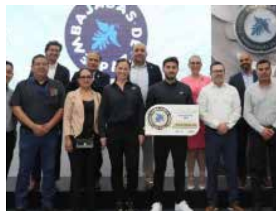
Participación en el evento: Informe de Actividades de la Estrategia Embajadas de Paz.