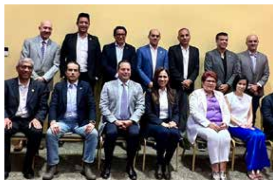
Comida entre fabricantes y comercializadores de la industria del calzado.