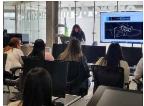
Visita de estudiantes de la Universidad de León a las instalaciones de CICEG