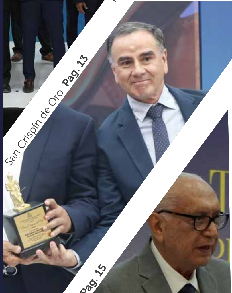
San Crispín de Oro Pag. 13