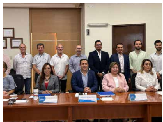
Agenda Electoral con el PRI.