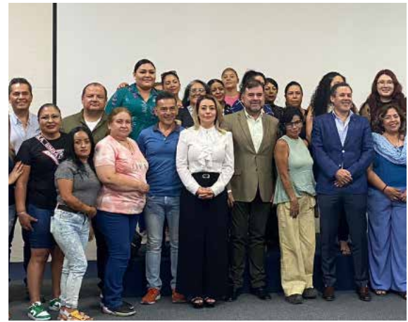
Evento del Programa CALZAYUDA para donar calzado al Colectivo de Búsqueda de Personas