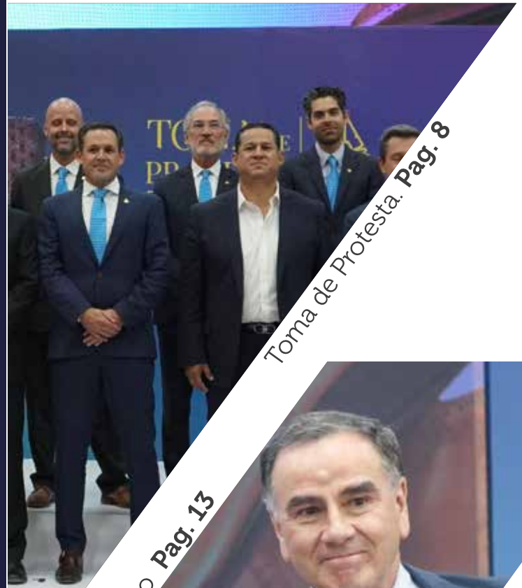
Toma de Protesta. Pag. 8