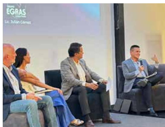
Meet Up Talk APIMEX-CICEG con el panel de empresarios