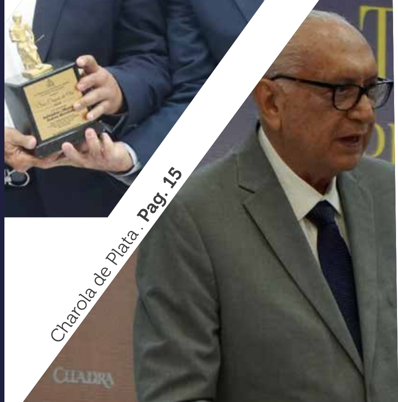
Charola de Plata . Pag. 15