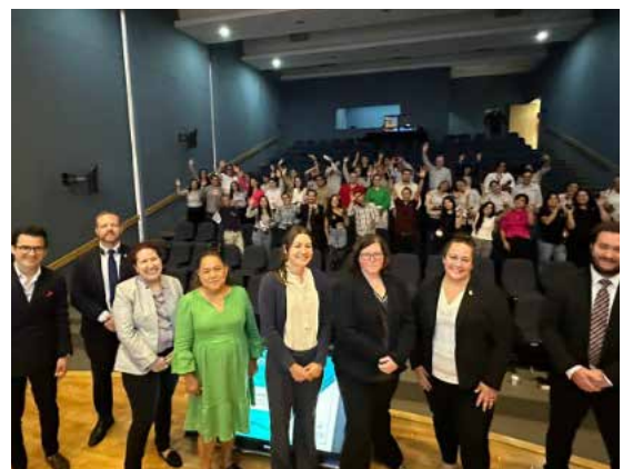
Seminario Cumplimiento y Requisitos Legales para la Importación y Exportación de Piel Exótica