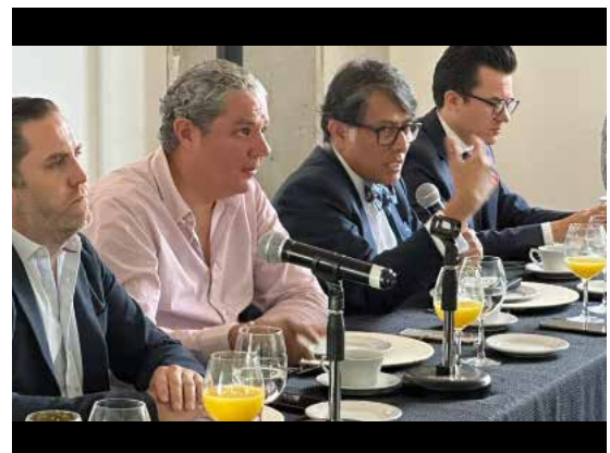
Industriales del Calzado para participar en la Investigación Antidumping.