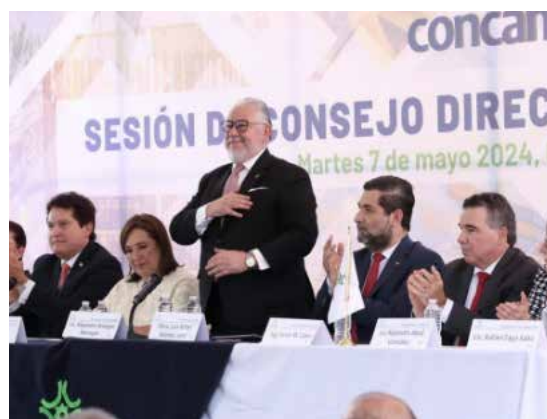
Participación en la Reunión de Consejo en CONCAMIN nacional.