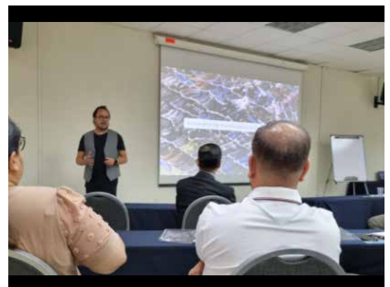
Conferencia de Branding titulada: “La Lealtad Vende”